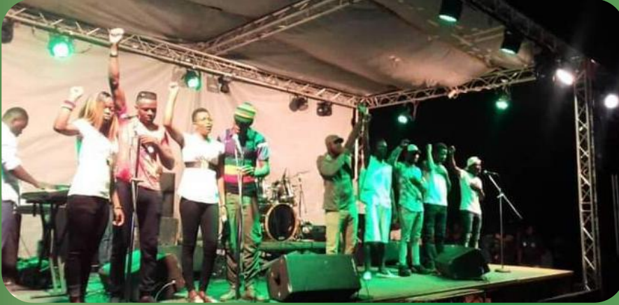
La communauté universitaire sur scène

Après l'édition 2020 manquée en raison des restrictions sanitaires liées à la pandémie de covid-19, la communauté universitaire de Parakou et les fans de cette star internationale de la musique reggae à Parakou se sont retrouvés un an plus tard pour célébrer le 40ème anniversaire de son décès. Pour le compte de cette année, le concert a été célébré en différé le vendredi 13 mai 2021.