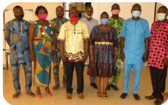
Photo de famille de quelques participants à l'atelier

la présentation des performances du secrétariat général de l'UP de 2018 à 2020 qu'une nouvelle vision de gestion administrative, intégrée à ses attributions courantes a été impulsée. De 2018 à 2020, toutes les rencontres statutaires programmées ont été tenues. De même, les activités de gestion des ressources humaines, notamment l'organisation des formations au profit du personnel ATS, l'élaboration des états d'effectifs des personnels enseignants et administratifs de l'UP, ont été réalisées. Ainsi, à compter de cette année 2021, le secrétariat général de l'UP s'est assigné la mission de direction transversale entre toutes les structures administratives de l'Université. Cette nouvelle vision de gestion administrative permettra d'assurer entre autres, la gestion des ressources humaines ; d'élaborer et de procéder à la validation de plusieurs textes réglementaires ainsi que la coordination des