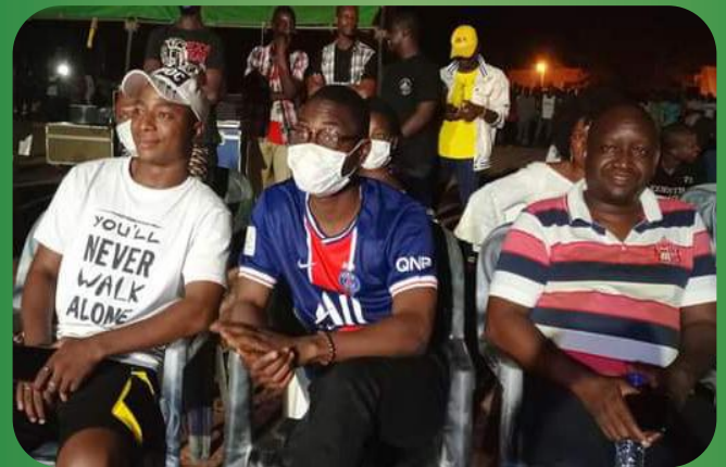
Les spectateurs du concert de Bob Marley