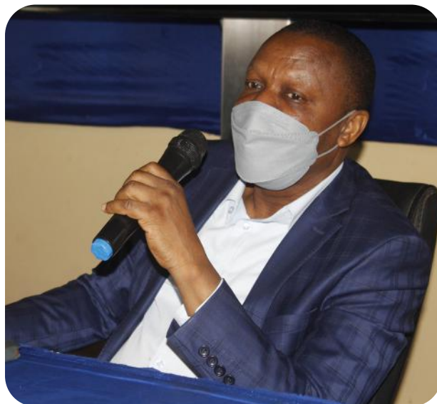
Recteur Prosper GANDAHO

clé le développement du processus de déclaration des classes, l'ajout des participants et la création de cours. Dans le deuxième module, il a été question d'outiller les enseignants sur la structuration d'un cours en ligne. En ce qui concerne le module 3, il s'est penché sur la création, l'ajout des activités comme réunion zoom, devoir et test. Le quatrième module a permis quant à lui aux participants de prendre contact du processus de création de cours et l'ajout de ressources. Avant de recevoir la procédure de conception des modalités d'évaluation, les enseignants présents ont eu droit au procédé de création de cours et d'ajout d'activité d'aide à l'apprentissage. Aux termes des deux jours de formation,