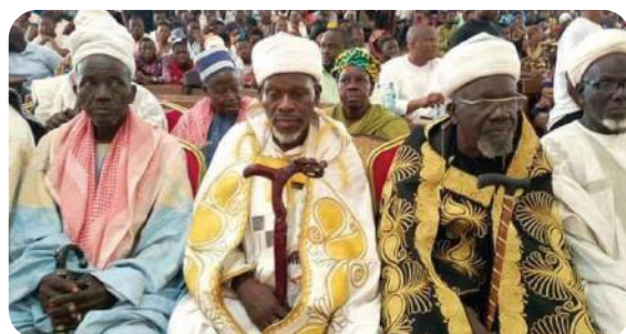
Les têtes couronnées au lancement de la rentrée

Il faut préciser que la délégation du ministère et du Cous-p a mis le cap juste au lendemain sur le centre universitaire de Natitingou pour une séance de travail qui a ainsi sanctionné définitivement la fin de cette rentrée des œuvres universitaires et sociales de Parakou.