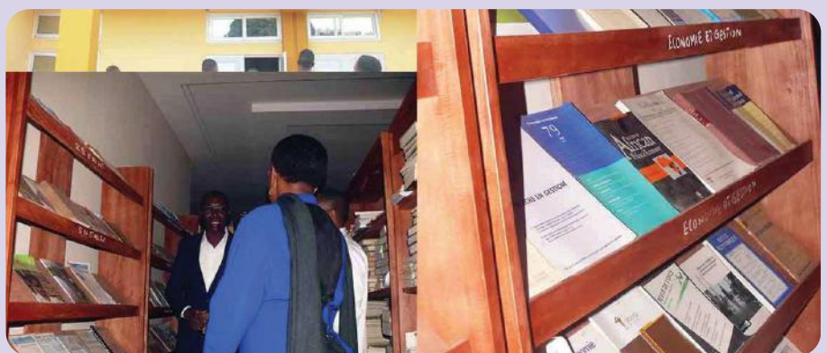
Madame la MESRS visitant le Centre de Documentation et d'Information (CDI)