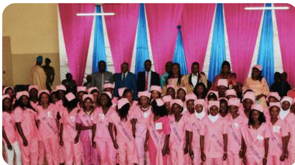
Photo de famille des récipiendaires (IFSIO)

Les salutations d'usage entre récipiendaires et autorités ont mis un terme à cette cérémonie.