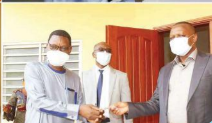
Quelques photos de la remise des clés des laboratoires de l'UP

T rois facultés de l'Université de Parakou ont désormais leurs laboratoires flambant neuf. Il s'agit de la Faculté d'Agronomie (FA) qui a bénéficié d'un laboratoire de