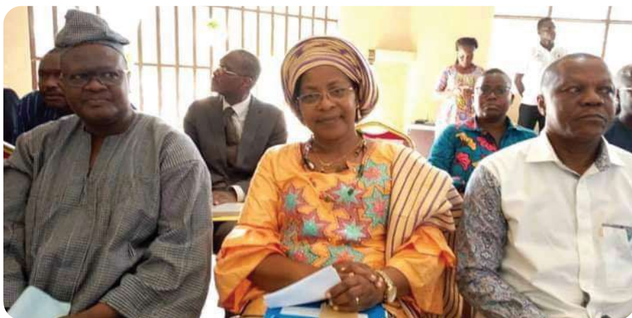
Vue des autorités au lancement de la rentrée