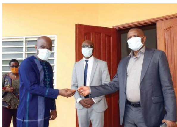
Remise de clés de 4 laboratoires à l'UP : Le Recteur GANDAHO renforce la recherche scientifique