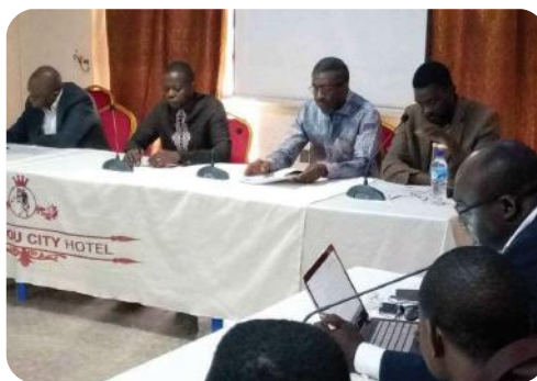
Vue partielle des organisateurs

Dans ses propos liminaires, le Doyen a primo témoigné sa reconnaissance aux formateurs invités qui ont répondu présents à son appel. Il a secondo rappelé le contexte dans lequel cet atelier est organisé, celui des réformes qu'il