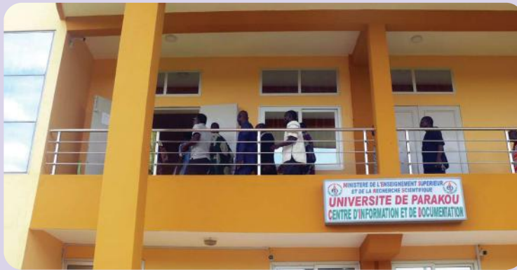
Les étudiants au Centre de Documentation et d'Information