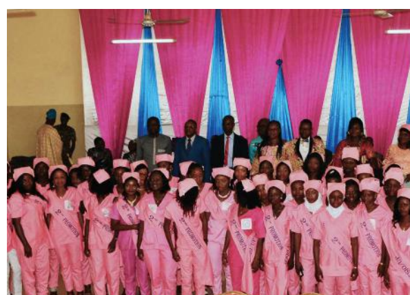
Remise de diplômes et prestations de serment de la 2 e promotion de l'IFSIO : 44 sages-femmes et 43 infirmiers livrés sur le terrain