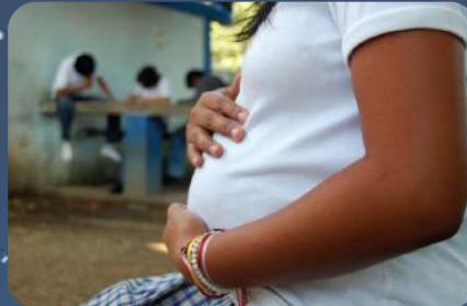
Une jeune fille enceinte

comportements sexuels, le genre en milieu scolaire et universitaire au Nord-Bénin en général et dans la ville de Parakou en particulier. A cet effet, les membres de ce projet et le Cinop auront à conduire des séances de sensibilisation et de formation pilotées dans les établissements concernés. Les cibles recevront des formations sur la santé sexuelle, la reproductive des adolescentes et jeunes.