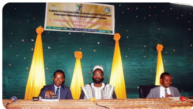
Le présidium de la rentrée des Masters

Les débats ouverts à la fin des communications ont marqué la clôture de la rentrée avec la satisfaction de tous les participants.