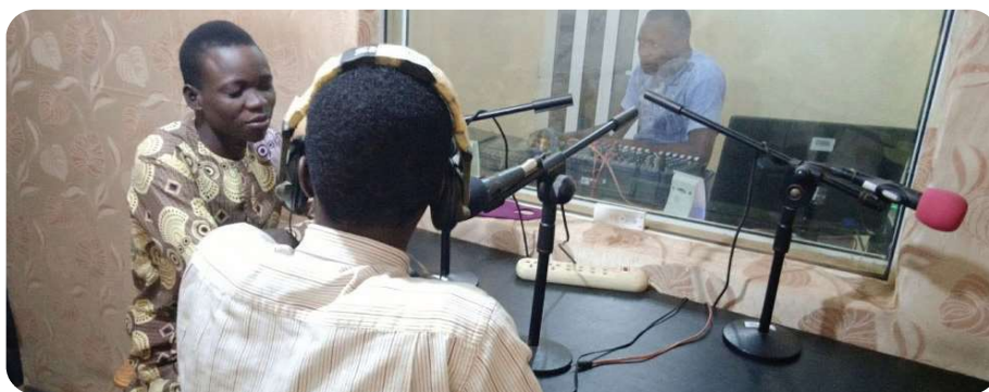
Vue partielle du studio de la radio UP-FM

L es élections communales et municipales du 17 Mai 2020 resteront longtemps gravées en lettres d'or dans les annales de l'histoire de la jeune station radio universitaire de Parakou, Up Fm. Et pour cause, elle a participé pour la première fois depuis sa création à la couverture médiatique des campagnes électorales. Pour mettre en application la mesure de faire des dites campagnes électorales exclusivement médiatiques en raison de la pandémie de la Covid-19, la Haute autorité de l'audiovisuelle et de la communication a retenu 67 radios, 6 télévisions et 55 journaux sur toute l'étendue du territoire national parmi lesquelles figure la radio Up Fm. « Nous pensons que l'autorité de régulation des médias au Bénin suit notre travail et c'est par rapport à ça qu'elle a accepté de porter son choix sur nous pour prendre en compte l'enregistrement et la diffusion des messages des candidats pour ces campagnes électorales qui viennent à un moment exceptionnel compte tenu de la pandémie qui sévit dans le monde entier. Donc